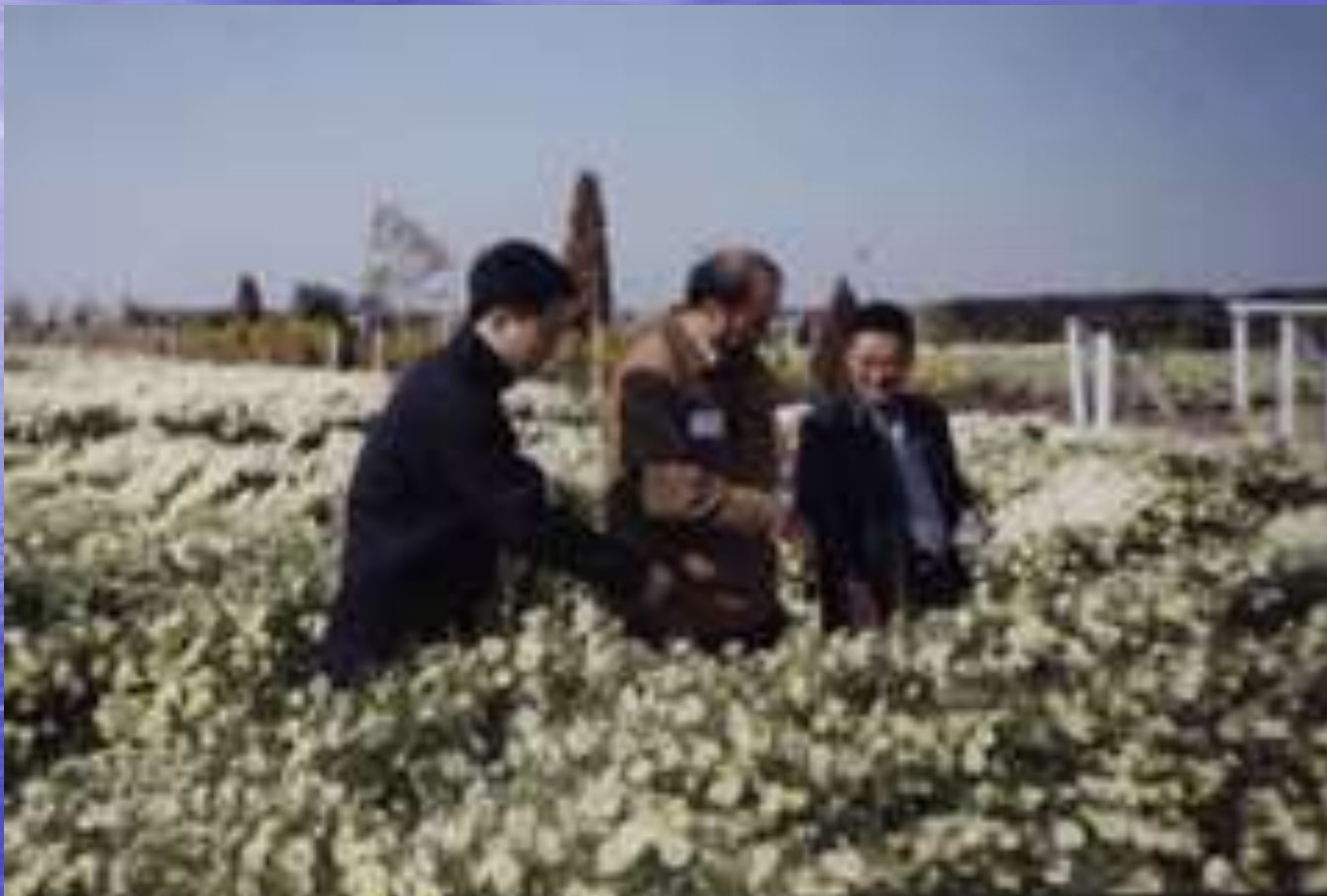
Chrysanthemum morifolium (Ju Hua), Jiansu Pr.