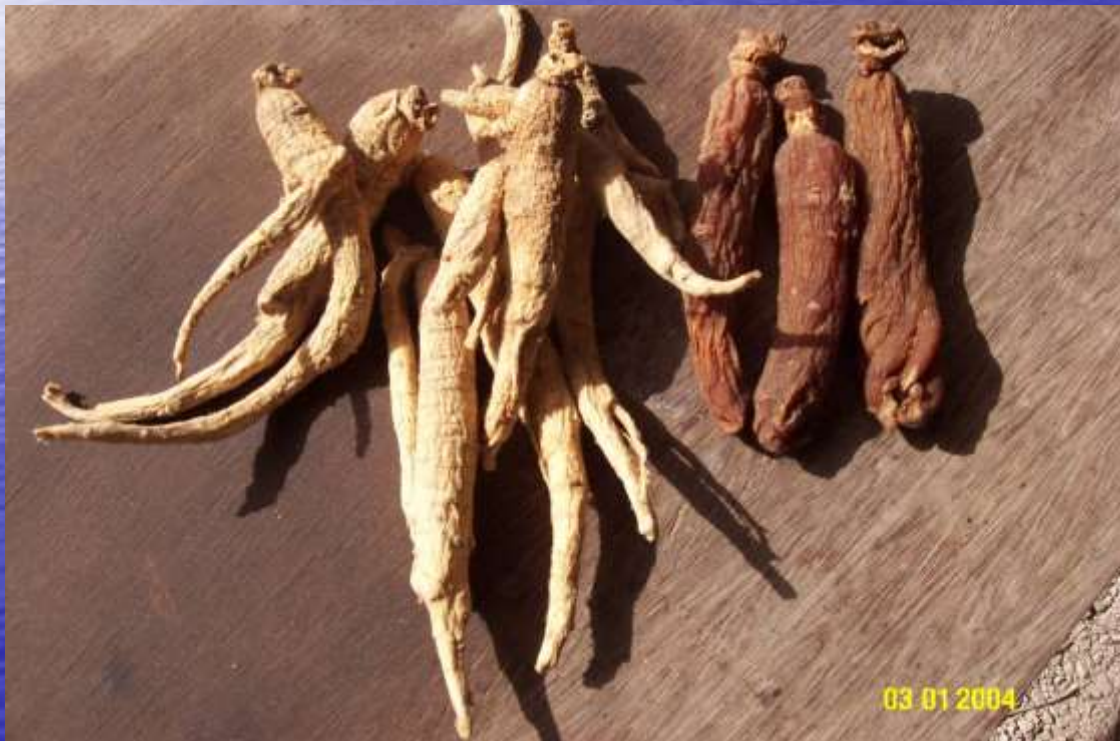
פרץ ג'ינסנג על עליץ Panax ginseng (Ren Shen)